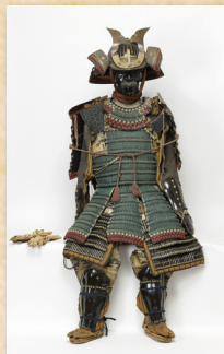
Armure de samouraï Japon, XIX e siècle, métal, cuir, textiles, corde, 185 x 62 cm Brest, musée des beaux-arts, legs Layrle, inv. 875.113

Cette première exposition présente des objets japonais rapportés en France dès le XIX e siècle par des grands marins tels que l'amiral Jean-Baptiste Cécille. Témoins du quotidien nippon de l'époque, ces objets inédits ou extrêmement rares rassemblés au musée de Brest sont aussi variés que surprenants. A côté de l'armure de samouraï, une statuette en ivoire est présentée parmi les coffrets, bols, bannettes, palanquins et laques, tous témoins de l'histoire maritime de Brest et du monde.