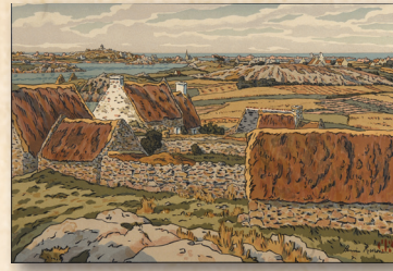
Henri Rivière, L'île de Bréhat (1864 – 1951) Lithographie en couleurs, 1913 Coll. Musée départemental breton, Inv. 2002.24.3.

Henri Rivière, sous l'influence de l'estampe japonaise et des paysages bretons, s'est imposé dans le domaine de la gravure sur bois par sa passion de la couleur. L'exposition présentée par le Musée d'art et d'histoire de Saint-Brieuc aborde l'œuvre d'Henri Rivière à travers un département et la diversité de ses modes d'expression.