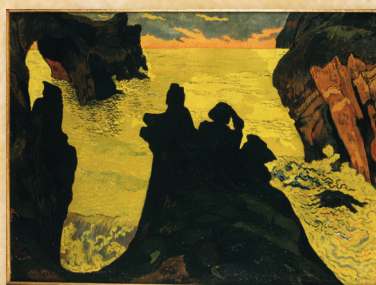
Georges Lacombe, La mer jaune, Camaret , Huile sur toile, vers 1892.

Dès 1893, Georges Lacombe peint les côtes bretonnes et bouleverse les fondements artistiques de l'époque pour adopter un style audacieux et coloré. À la suite de Paul Gauguin, les peintres Nabis et ceux de l'école de Pont-Aven vont ainsi s'intéresser à une nouvelle manière de représenter la nature en transformant les cadrages, courbes, arabesques et couleurs.