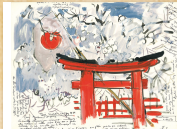
Printemps à Kyoto, encre et gouache sur papier, 31-40cm, Dinan, maison d'artiste de la Grande Vigne © ADAGP 2012

« Le Japon dans la correspondance de Mathurin Méheut » 16 mai – 30 septembre 2012