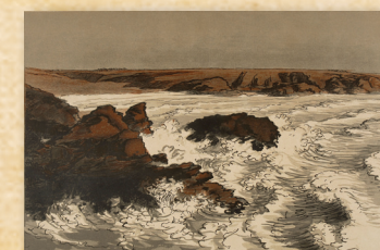
Jacques Beltrand, Gros temps à Belle-Île ou Les Rochers rouges , ou La Vague , 1930, bois gravé imprimé en couleurs, 28,7 x 36,5 cm, Quimper, Musée départemental breton.

La découverte de l'estampe japonaise fit naître en France, à la fin du XIX e siècle, une vogue pour la gravure sur bois imprimée en couleurs. Pour la première fois en France, l'exposition révèle ce mouvement artistique auquel on doit certaines des plus belles gravures d'inspiration française et bretonne.