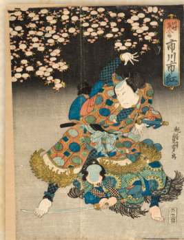
Hokuëi, estampe XIX e siècle

Dans le cadre d'un jumelage pérenne entre Rennes et Sendai depuis 1967, onze kimonos de prestige furent offerts par la ville japonaise à la capitale bretonne. Certains d'entre eux, aujourd'hui exposés, ont été confectionnés dans les années 1950 mais furent créés sur des modèles anciens dont les motifs datent du XIII e siècle.