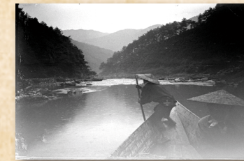
Francis Hennequin, Rapides du Hotzu - Mariniers , Photo sur plaque de verre stéréoscopique, vers 1912

« Le voyage de Francis Hennequin au Japon, un photographe de Douarnenez au pays du soleil levant » 12 mai – 30 Juin 2012