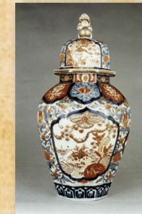
Vase balustre, décor floral Imari Japon, Fin du XVII e siècle, Dépôt du musée des Beaux-Arts de Rennes au musée de la Compagnie des Indes

« Odyssée de l'Imari » - Une exposition présentée hors-les-murs à l'Hôtel Gabriel, Endos du port, Lorient - 9 juin – 2 septembre 2012