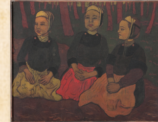
Georges Lacombe, Trois bigoudènes dans la forêt, Peinture à l'œuf sur toile, 1894-1895

Le japonisme s'est manifesté en particulier par l'influence de l'art de l'estampe sur les peintres de l'École de Pont-Aven et ceux du groupe des Nabis. Ils y ont trouvé de nouvelles manières de représenter l'espace et des innovations graphiques.