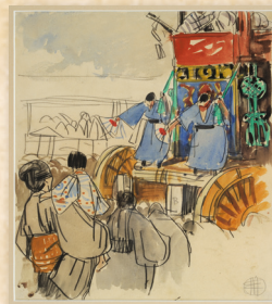
Mathurin Méheut, Les saltimbanques, Crayon et aquarelle sur papier, 37 x 29cm, Collection particulière

Le peintre breton Mathurin Méheut entreprend en 1914 un voyage au Japon, financé par Albert Kahn. Il observe les paysages et personnages rencontrés à travers les provinces d'Osaka, Nara ou encore Kyôto.